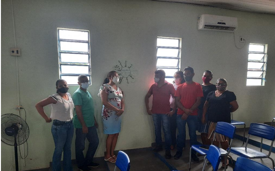
FORMAÇÕES COM OS PARTICIPANTES PROFISSIONAIS DA EDUCAÇÃO