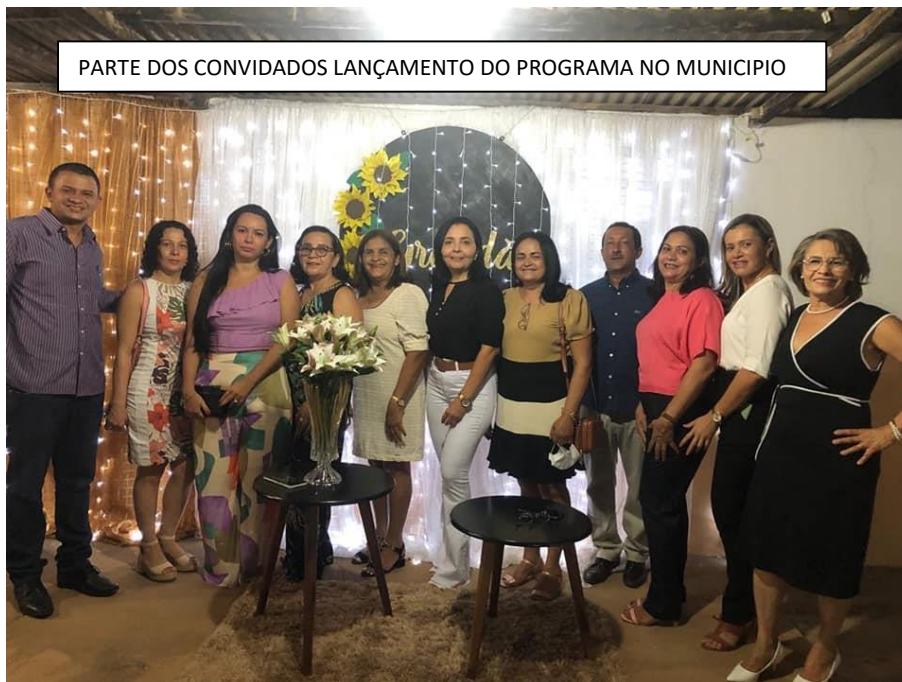
PARTE DOS CONVIDADOS LANÇAMENTO DO PROGRAMA NO MUNICÍPIO