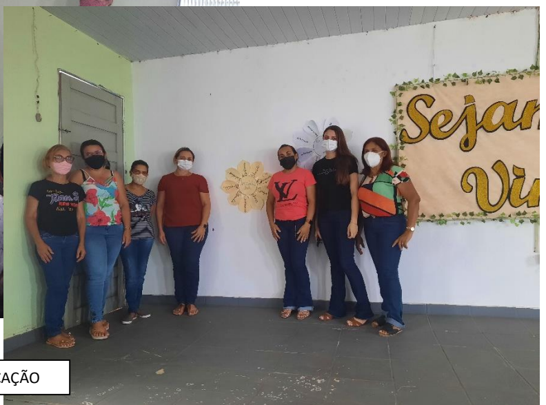
FORMAÇÕES COM OS PARTICIPANTES PROFISSIONAIS DA EDUCAÇÃO