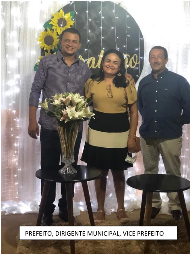
PREFEITO, DIRIGENTE MUNICIPAL, VICE PREFEITO