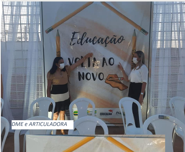
DME e ARTICULADORA