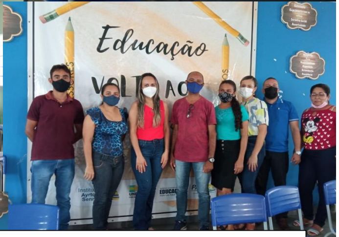
FORMAÇÕES COM OS PARTICIPANTES PROFISSIONAIS DA EDUCAÇÃO