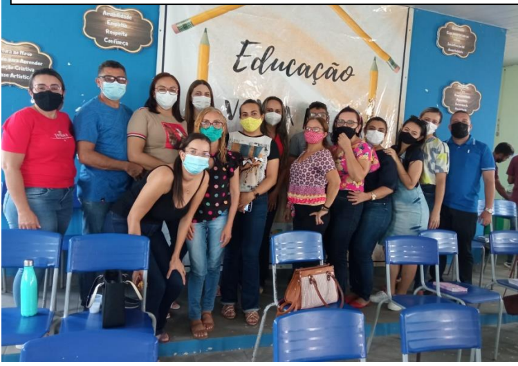
FORMAÇÕES COM OS PARTICIPANTES PROFISSIONAIS DA EDUCAÇÃO