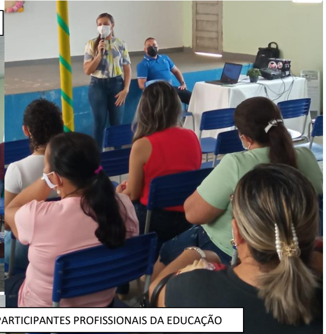
FORMAÇÕES COM OS PARTICIPANTES PROFISSIONAIS DA EDUCAÇÃO